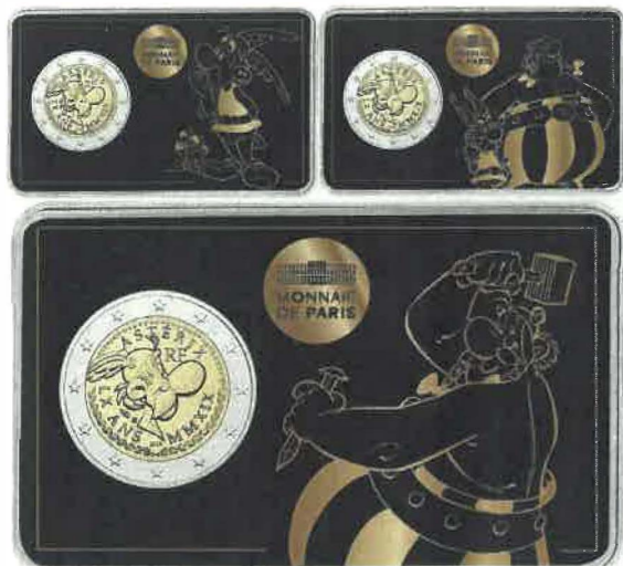
Asterix na evrskem kovancu