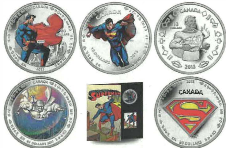
Leta 2013 je Kanada izdala nekaj spominskih kovancev ob 75. obletnici Supermana.